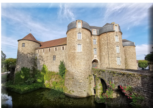
Visite du château et du musée de Boulogne-sur-Mer le matin

ANGRES LA GAZETTE N° 186 Mai 2022 Périodique d'information Directeur de publication : Maryse COUPIN Rédaction, photographies : Service Information Angres