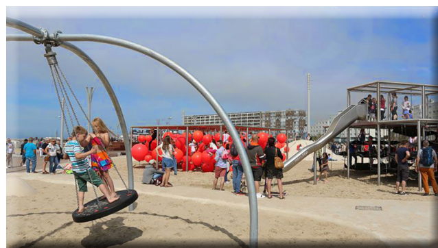
Après-midi plage et aire de jeux à Calais

Pour plus de renseignements et inscription contactez le CCAS au 03 21 44 97 26